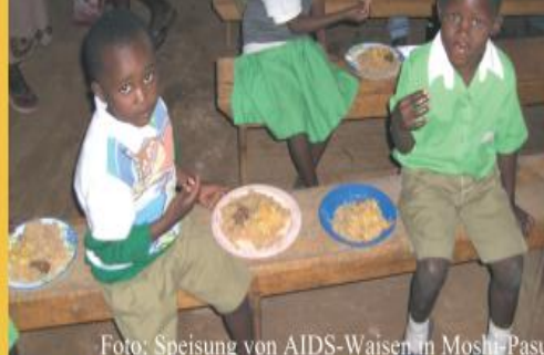
Foto: Speisung von AIDS-Waisen in Moshi-Pasua

Moshi - eine Großstadt am Fuße des Kilimandscharo in Tansania. Pasua - ein kleiner Vorort von Moshi. Hier ist die evangelisch-lutherische Kirchengemeinde zu Hause, mit der Idstein seit 1988 eine fest gewachsene Gemeindepartnerschaft verbindet. Die evangelische Kirchengemeinde unterstützt ihre Partnergemeinde beim Bau von Kindergärten, Kirchen, des Pfarrhauses und der gemeindeeigenen Grundschule. Im zweijährigen Wechsel besuchen Delegationen aus Pasua und Idstein gegenseitig die Gemeinden - denn Partnerschaft lebt nicht nur von Geld, sondern vor allem von den persönlichen Kontakten.