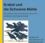
Krabat und die Schwarze Mühle Mittelalterliche Geschichten Geschichten aus dem Mittelalter Band 7