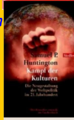
Samuel P. Huntington: Kampf der Kulturen Die Neugestaltung der Weltpolitik im 21. Jahrhundert