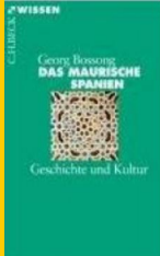
Georg Bossong: DAS MAURISCHE SPANIEN Geschichte und Kultur