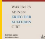
WARUM ES KEINEN KRIEG DER KULTUREN GIBT